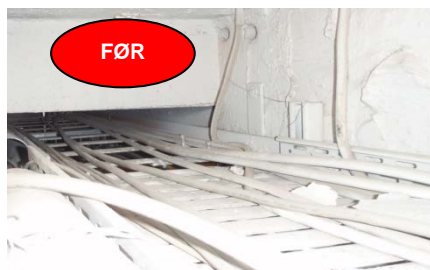
Større huller lukkes med brandplade. monteret med brandmastik